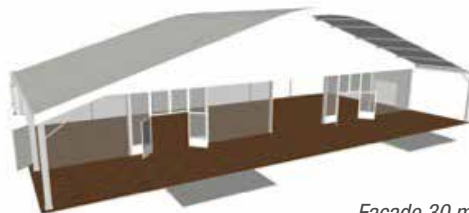
Façade 30 mètres