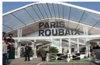
Façade 20 mètres