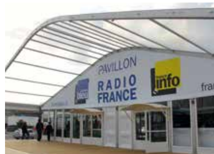
Façade 30 mètres