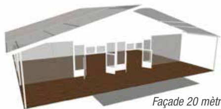
Façade 20 mètres